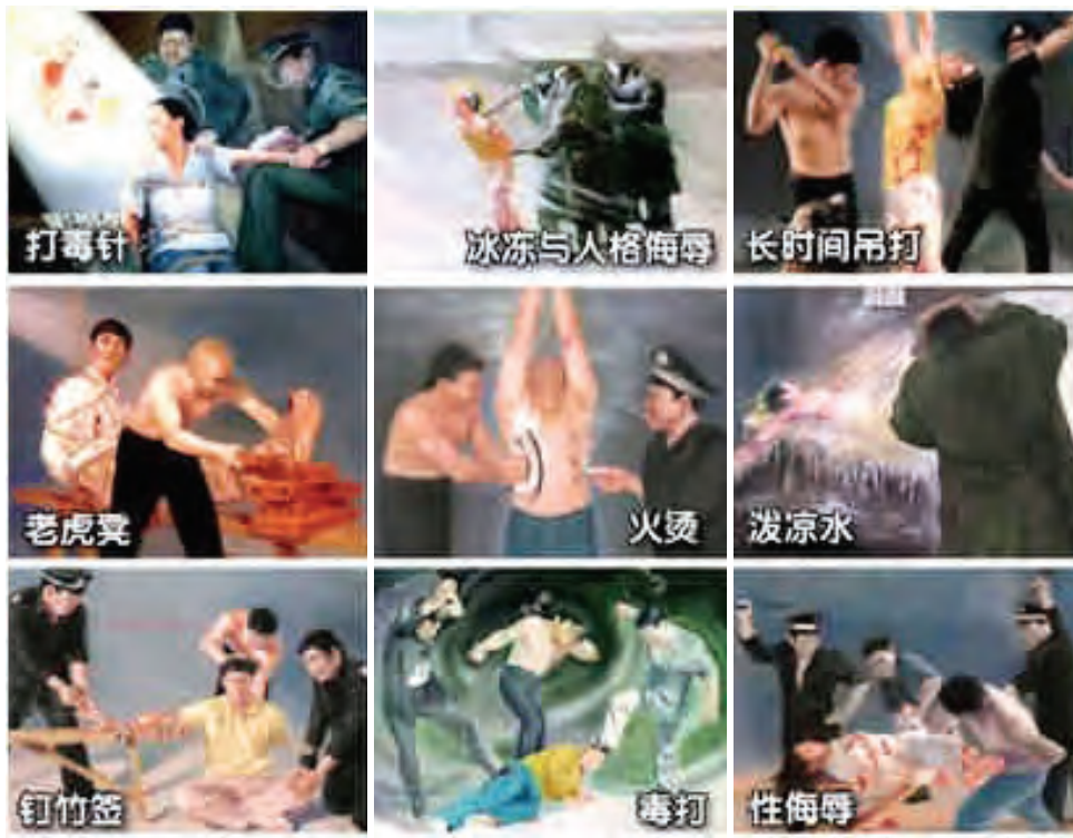
中共對法輪功學員施加的酷刑演示。

一九九九年七月二十二日下午，中央電視台播放了所謂的取締通告後，鎮政府的書記、鎮長二人到我家，叫我通知同修不要來我家集體煉功。晚上八點，來了好幾輛警車和大量警察包圍了我家，把我綁架到公安局審問。他們想讓我說法輪功的壞話，我一直不配合。警察把我關進不見陽光的、有一尺多深的臭水牢房裏，三天後關入看守