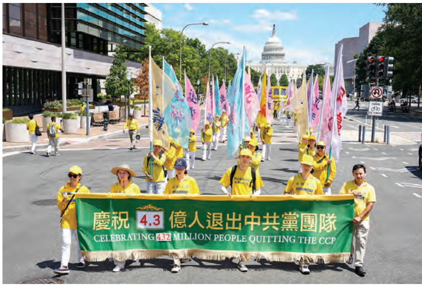
二零二四年七月十一日，法輪功學員在美國首都華盛頓特區舉行遊行，呼籲停止迫害法輪功，聲援四億三千多萬中國民眾退出中共及其相關組織。

一位男學生打斷我的話說：「那你們為甚麼到天安門自焚啊？」我說：「這正是中共在天安門廣場編造、導演的一齣大戲、一場騙局。」我說：那個自焚的王進東兩腿間的雪碧瓶是裝汽油的，大火把他全身都燒著了，那個塑料雪碧瓶不但沒化掉，咋絲毫沒變形呢？他的臉被火燒成那樣，為甚麼最容易著火的頭髮、眉毛卻完完整整，可能嗎？那麼大的天安門廣場，自焚的火一著，半分鐘不到，二十多個警察人人手裏都有了一個滅火器，還有滅火毯，哪來的？稍微一動腦子想想就知道這是中共編造出來誣陷法輪功、欺騙善良的中國老百姓的一場戲，也是為了欺騙全世界