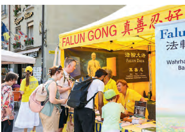
七月二十七日在瑞士伯爾尼廣場，不少路人向法輪功學員了解更多訊息。