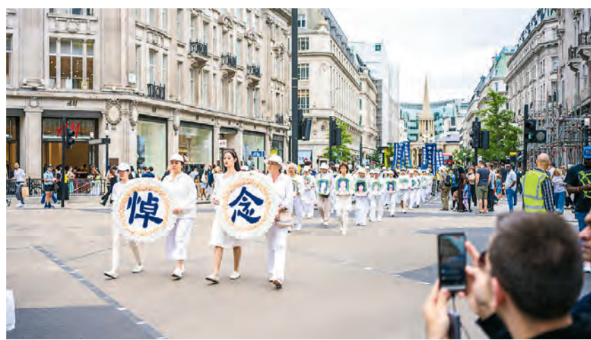
今年七月，法輪功學員在英國倫敦遊行，要求中共停止迫害。

能平躺睡覺，睏了只能坐著睡一會。可監號值班犯人還不讓她坐著，她躺下又受不了，吃不進去飯菜，勉強吃一點就嘔吐。可是看守所置之不理。