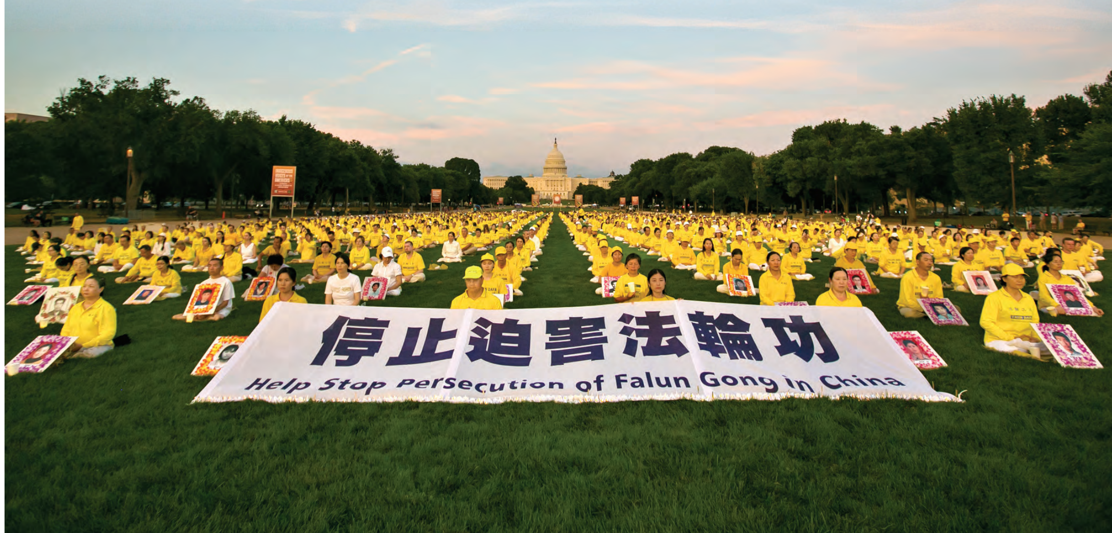
2024年7月11日，法輪功學員在美國首都華盛頓DC燭光夜悼，呼籲立即停止迫害。