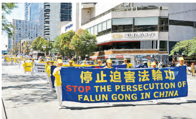
二零二四年七月二十日，法輪功學員在加拿大溫哥華市中心遊行呼籲制止中共迫害。

黃女士從大陸來到加拿大已有多年，她覺得「擁有民主自由的地方跟沒有自由的地方完全不一樣」，加拿大是能