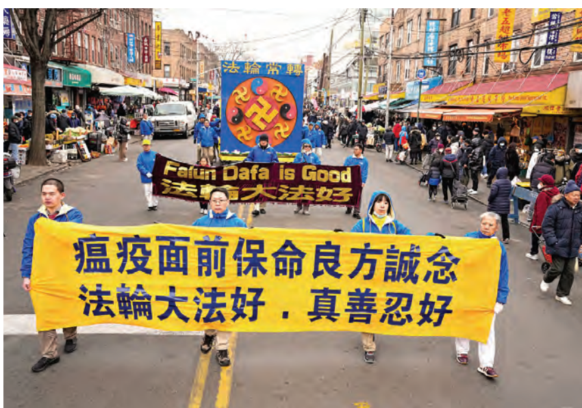
2023年2月26日，美國紐約布魯克林大遊行，呼籲停止迫害法輪功，並向民眾傳遞避疫良方。