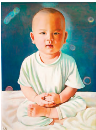
繪畫：小認真。作者：法輪功學員