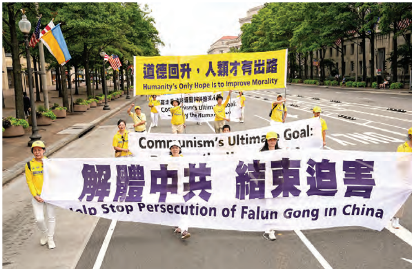
2022年7月21日，海外法輪功學員在美國首都華盛頓DC舉行反迫害大遊行，呼籲立即制止中共迫害，並聲援中國人三退（退出中共黨、團、隊組織）。