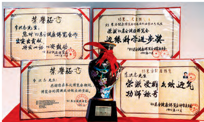
在北京1993年東方健康博覽會上，法輪功創始人李洪志大師獲得博覽會最高獎「邊緣科學進步獎」和大會「特別金獎」及「受群眾歡迎氣功師」稱號。