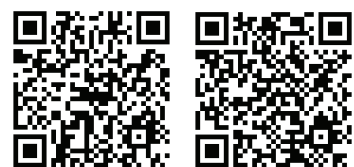
自由門電腦版 自由門安卓版

2 網址索取：（通過以下網址下載自由門翻牆軟件） 電腦版： https://j.mp/fgp88 安卓版： https://j.mp/fgv88