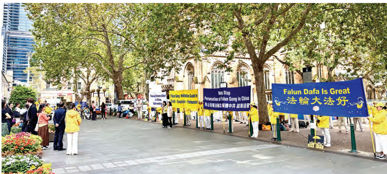
三月二十一日，法輪功學員在悉尼市政廳前集會抗議中共迫害。