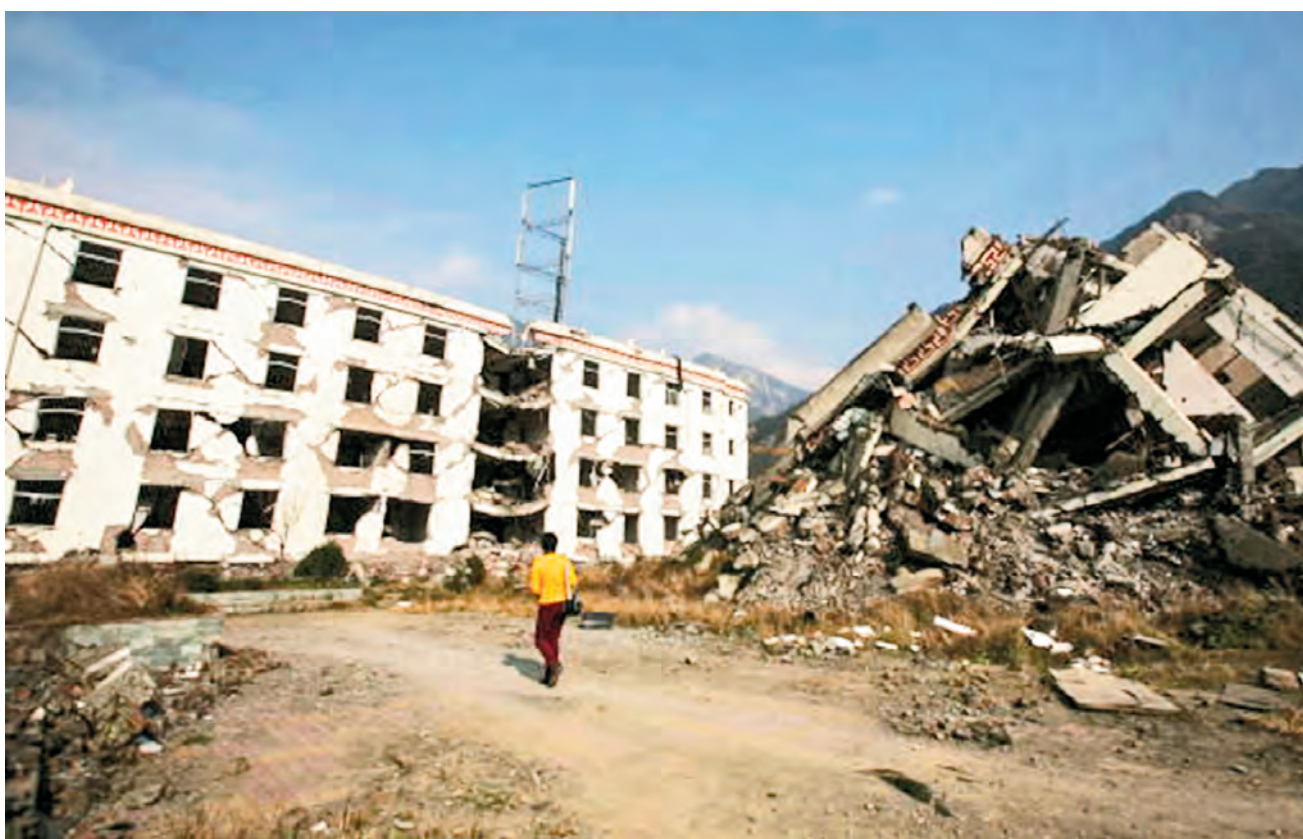
汶川地震中倒塌的房屋。

我告訴他們：「我是煉法輪功的，我有師父保護。大法師父講『佛光普照，禮義圓明』(《轉法輪》)，所以你們這麼多人、這麼多車都沒有一點損失，都是師父在管你們。你們都要記住『法輪大法好、真善忍好』。」他們說：「阿姨，我們沒有一點損失，謝謝您。如果我們下次再見面的話，我們一定要報答您。」他們跪在地上給我磕頭。