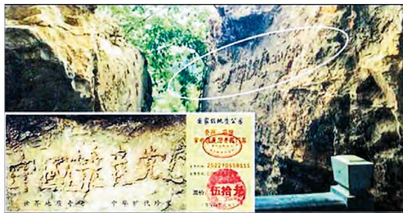
大圖：貴州省平塘縣「藏字石」的斷裂面，小圖為風景區的門票，大陸媒體只報了前面的五個字，不敢報最後的「亡」字。

德、義、禮、仁、信是為人處世的五種傳統美德。明慧網上有「五德」的典範故事，班昭、貂蟬、孟光、長孫皇后、王寶釧樹立的五德雋永完整，回味無窮。