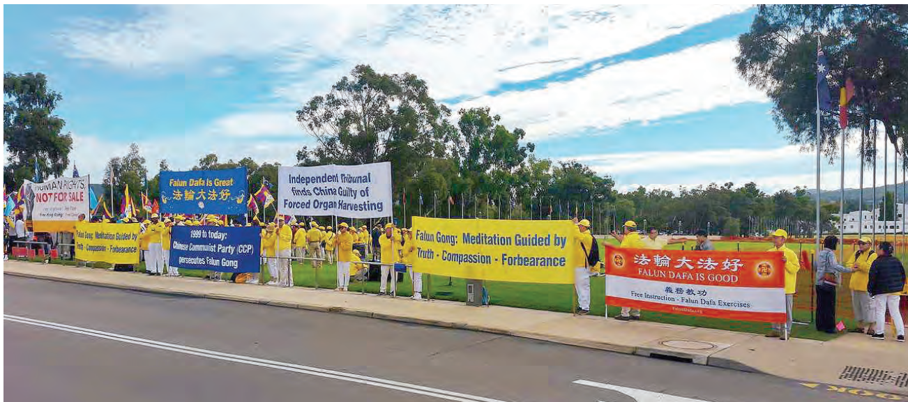
三月二十日，澳洲部份法輪功學員在首都堪培拉國會大廈前集會，呼籲制止迫害。

他說：「今天我們在這裏不僅對澳洲政府和民眾發聲，也是對中國公民和政府發話，展現的是人心所向，我們