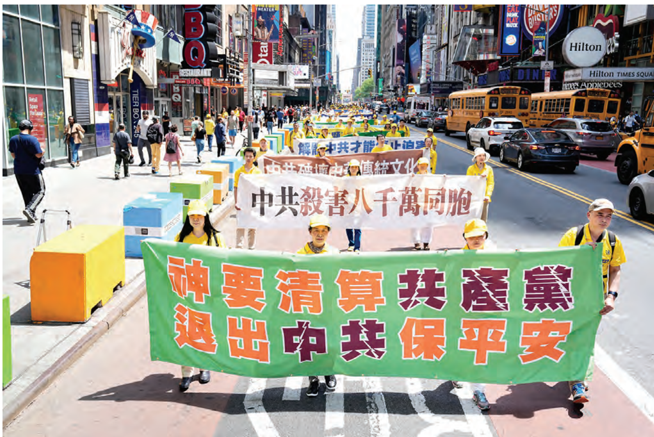
2023年5月12日，大紐約地區部份法輪功學員在美國紐約曼哈頓舉辦盛大遊行，慶祝法輪大法弘傳世界31週年，聲援4億多中國人退出中共黨團隊組織。

我看他很認同，接著說，我們單位的工資獎金是政治部的人發的嗎？沒有他們十幾人，工人還能多分點獎金。是共產黨給的嗎？他馬上肯定地說：那肯定不是。我又說，共產黨不是經濟實體，它無法創