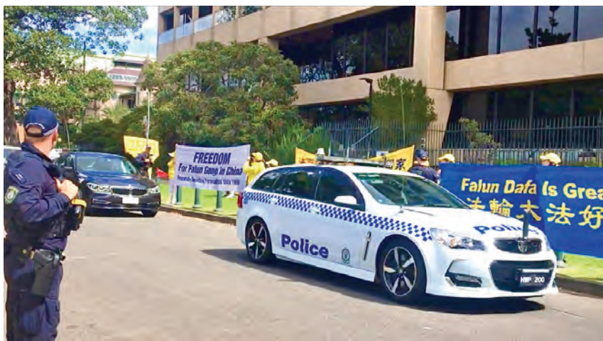
中共外長王毅的車隊在法輪功學員前經過。